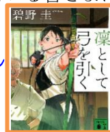
『凍として弓を引く』